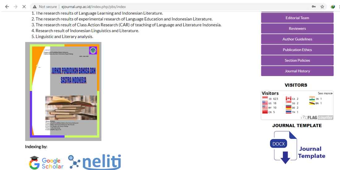
Gambar 1. Pengunduhan Template Artikel di Jurnal Program Studi Pendidikan Bahasa Indonesia

Draft artikel dibuat berdasarkan template masing-masing jurnal program studi Jurusan Bahasa dan Sastra Indonesia dan Daerah. Untuk melihat template masing-masing jurnal program studi, dapat diunduh pada halaman awal masing-masing jurnal.